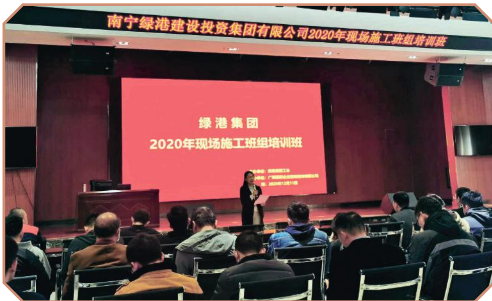
工程现场管理培训现场

2020年12月11日，绿港集团2020年在岗职工技能提升培训班第四期——现场施工班组培训班圆满结束，本期培训班的结束，标志着绿港集团2020年在岗职工技能提升培训圆满结束。