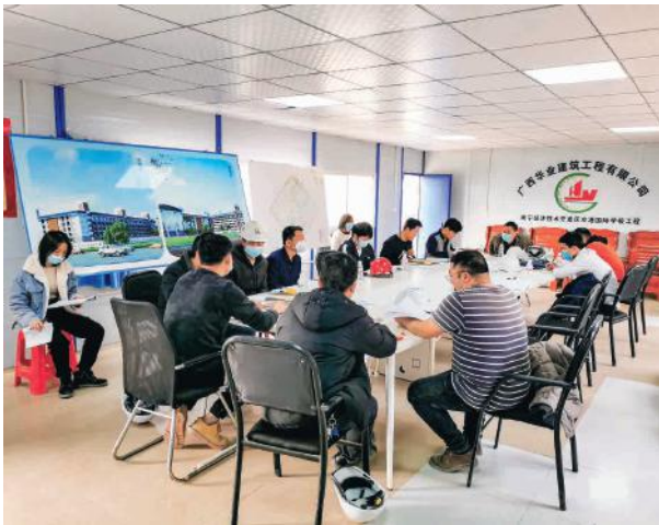
南宁经济技术开发区空港国际学校学生宿舍楼主体结构验收会议

2021 年 1 月 15 日，由绿港集团下属科巨公司建设的南宁经济技术开发区空港国际学校学生宿舍楼项目顺利通过主体结构验收。