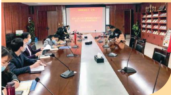
机关一支部会议现场

和今后一个时期的重大政治任务，集团总部及各子公司要进一步提高政治站位，深刻领会全