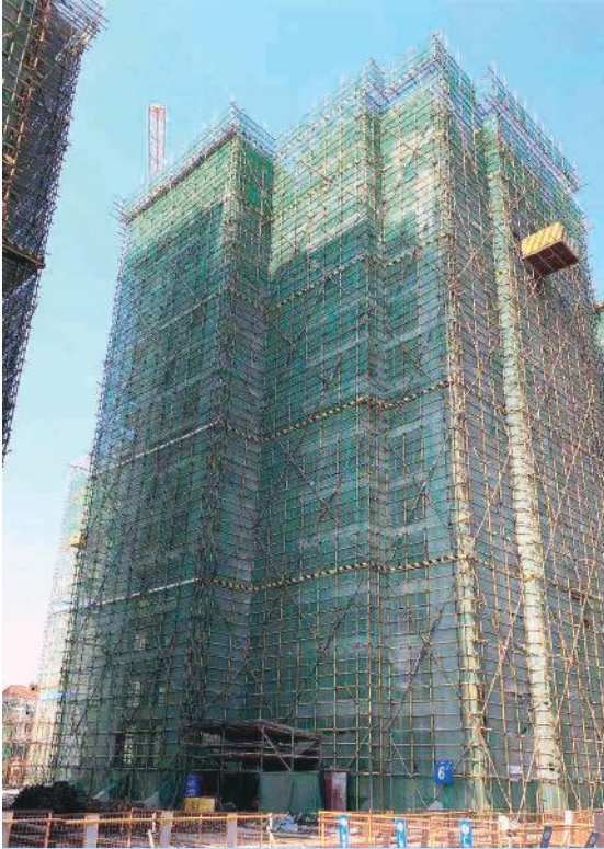
绿港·云海湾项目6#楼