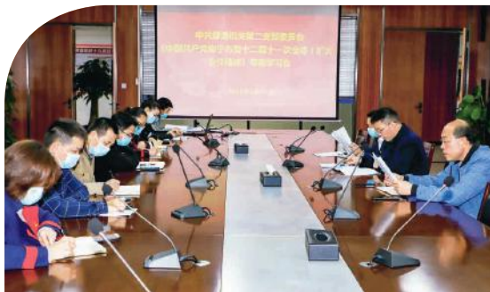
机关二支部会议现场