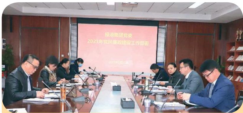
绿港集团党委召开2021年党风廉政建设工作部署会议