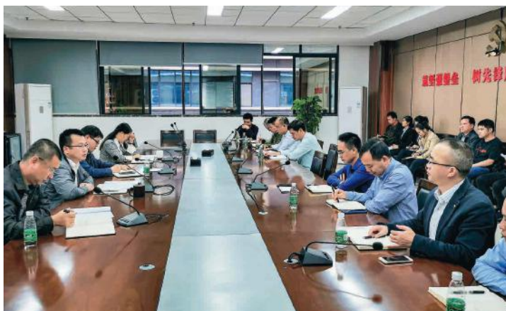
集团公司召开“营商环境大提升”工作专题会

筑好巢才能引凤来。随着南宁经开区“双抓双促，两区统筹”发展战略的大力实施，电子信息、生物医药、先进装备制造等产业快速发展，作为产业发展有效载体的标准厂房数量不足成为了制约经开区产业发展的瓶颈。为了破解这一难题，绿港集团勇挑重担，陆续开工建设了空港科技产业园、建科工业园、绿港·双创城、金瑞产业城、金阳产业城、春吉产业孵化园等一批工业园区项目，近年来累计开工建设面积73万平方米。