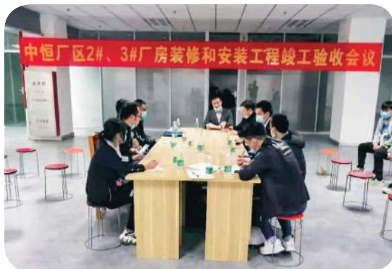
竣工验收会议现场