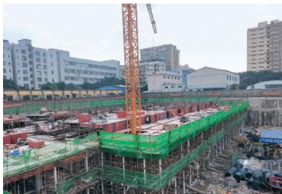
绿港·双创城项目6#、8#楼主体工程基准面下工程完成

路7号,项目由6栋高4~26层的双创中心组成,总用地面积约36.58亩,总建筑面积123879.46m 2 。项目共建设1栋26层高层双创中心(1#)、1栋23层高层双创中心(2#)、4栋4层双创中心(3#、5#、6#、8#)及地下室2层。该项目是经开区首批得到管委会批复建设的2.5产业园区之一,是经开区促进辖区生产性服务业发展,打造先进制造业和现代服务业高地的示范性项目,建成后可为经开区提供工业生产市场化中间服务,可引进科技研发、软件开发、工程设计及咨询服务、节能环保服务、新一代信息技术服务等企业,有力助推经开区核心实体经济的发展。通过该项目的开发建设,绿港集团不仅可为自身开辟全新的项目开发领域,积累此类国际产业聚集示范园区的建设经验,