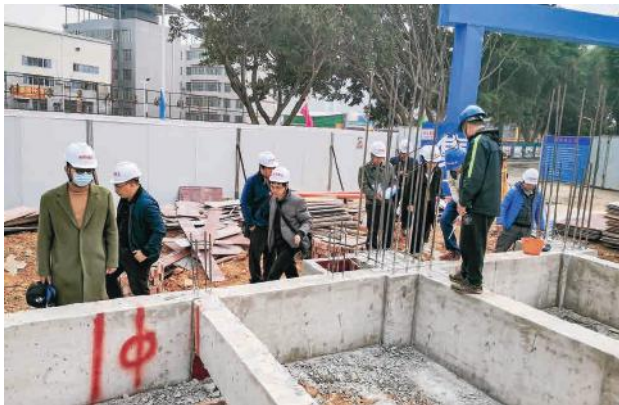
验收组对基础梁进行实地查看

项目建成后将进一步提升学校教学环境，也将极大缓解周边因人口急剧增加带来的入学压力，为经开区义务教育均衡发展谱写新的篇章。