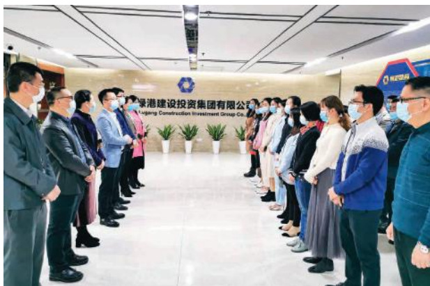
集团领导班子到集团总部及各子公司开展新春走访慰问活动