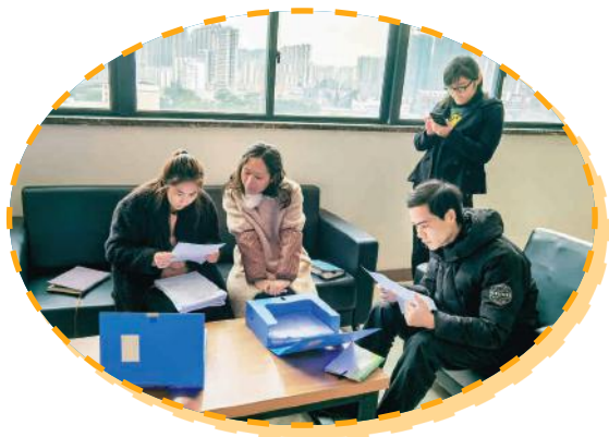
合同台账检查现场

合同台账联合检查小组人员把合同台账存在的问题面对面的与经办人进行指导交流，并出具合同台账检查报告，有针对性地提出合理有效的防范措施，确保了集团公司资产的安全