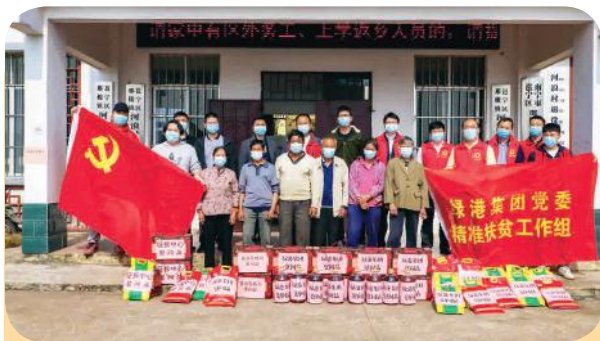
慰问组与村干部、贫困户合影