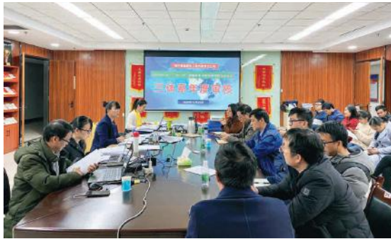
ISO“三位一体”管理体系专家年度审核会议现场

程，结合自身实际举一反三，查找问题，对现存和潜在的问题认真分析原因，制订切实可行的纠正预防措施及实施计划，做到措施有效、落实到位，要在采取措施工作中不断改进完善体系的有效性，不断创