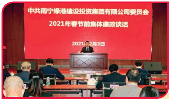
2021年春节前集体廉政谈话会现场

二是树牢“一盘棋”思想，做清风绿港的捍卫者。要坚持经济发展和党风廉政建设“两条腿走路”，合力营造风清气正心齐的良好局面。全体干部职工切实做到“一盘棋”、“一股劲”、