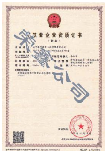
荣鑫公司建筑装修装饰工程专业承包壹级资质证书

司的市场竞争能力，为公司做大做强打下了坚实的基础。同时，荣鑫公司也将以此为契机，内强素质、外塑形象，不断提升公司的装修装饰等方面的实力，打造出具有特色的企业品牌，继续创造“南宁速度”新佳绩。