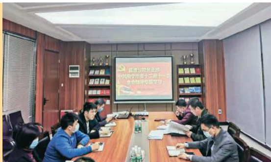
嘉通公司党支部会议现场