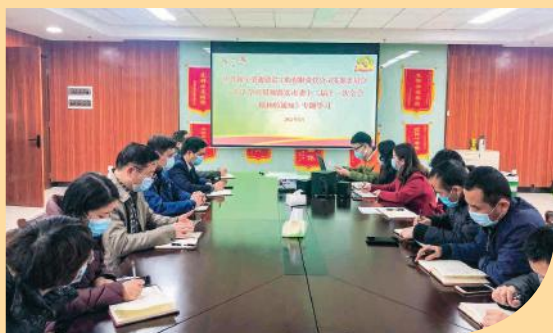
荣鑫公司党支部会议现场

会的重点任务和工作要求,学懂弄通,入脑入心,要把会议精神与中央经济工作会议和全区经济工作会议精神有机结合起来,主动践行国企担当,全面推进党的建设高质量发展,统筹抓好常态化疫情防控和企业改革发展,紧紧抓住强首府发展战略和南宁临空经济示范区的重大机遇,奋斗不息,奋发有为。