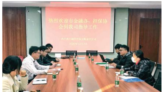
担保业务核查现场

会上，核查小组听取了中港兴公司的汇报，查阅了相关资料并与公司中层以上人员进行交流。经过现场交流及检查，金融办考核组对中