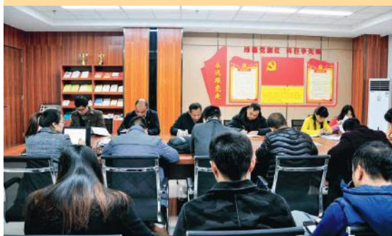
科巨公司党支部会议现场