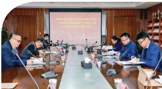
绿港集团党委专题学习会现场