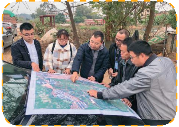
项目负责人与设计单位进行现场勘探

工程，近年来绿港集团高度重视耕地提质改造项目，此前已顺利获得南宁吴圩镇玉米研究所片区土地提质改造（旱改水）、南宁吴圩镇新桥村土地提质改造（旱改水）项目用地指标 45.77 公顷。绿港集团不断挖掘资源，通过自我加压方式，又新增拓展吴圩镇平垌村耕地提质改造项目。项目建成后，将进一步破解南宁临空经济示范区当前土地“占补”瓶颈问题，同时也将大幅度提高农田生产能力，降低农业生产成本，有效改善土地利用格局，促进农业增效和农民增收。